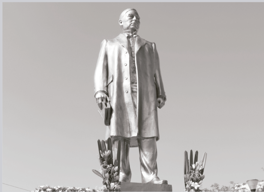
El Benemérito de las Américas Benito Juárez García.

fueron propuestas por la propia población del municipio.